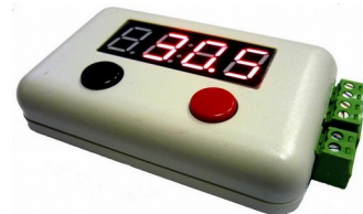
Рис. 4 Вариант оформления устройства.

Подключение модуля MP220ор на 220В, для управления мощной нагрузкой до 4 кВт (приобретается отдельно)