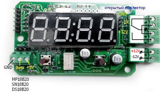
Рис. 2 Назначение разъемов.

Перед началом эксплуатации необходимо сделать сброс!