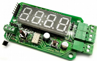
Рис. 1 Общий вид устройства.

Предлагаемый блок в собранном виде позволяет реализовать принцип: купил – подключил. Блок позволит радиолюбителю получить простой и надежный цифровой термостат с возможностью измерения и контроля температуры в диапазоне -55°С до +125°С. Устройство будет полезно для применения в быту, дома, на даче, бане или погребе. С его помощью можно производить измерения температуры окружающей среды, контролировать и регулировать рабочую температуру электрических котлов, теплого пола, теплиц, холодильных установок или морозильных камер. Устройство запоминает настройки гистерезиса при отключении питания.