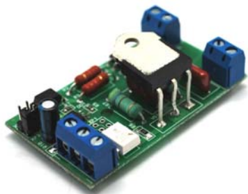
Рис.1 Общий вид собранного устройства

Вы любите программировать микроконтроллеры!? Теперь вы легко можете решать задачи управления мощностью в сети 220В переменного тока. Мы сделали регулятор мощности, который легко подключить к микроконтроллеру. Просто соедините ШИМ-выход микроконтроллера с нашим регулятором мощности и программно управляйте электроприборами: плавно включайте электродвигатели, регулируйте температуру нагрева и многое другое.